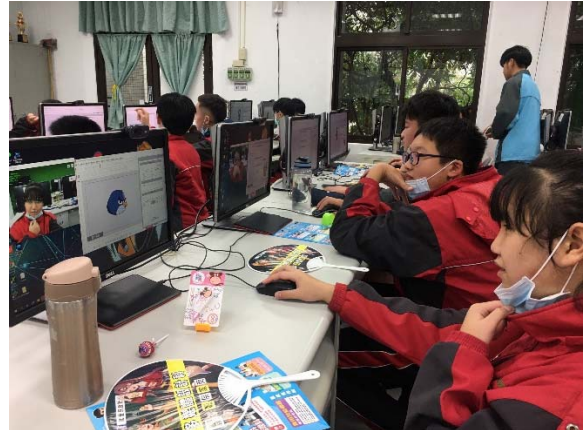
說明：設計群-多媒體設計科實作體驗