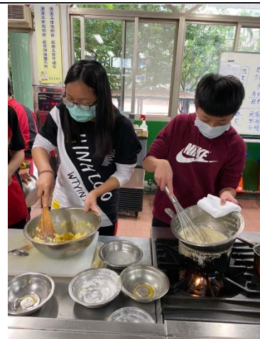
說明：餐旅群-餐飲管理科實作體驗