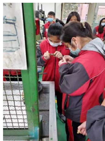
說明：機械群-模具科實作體驗