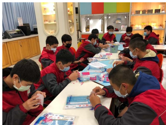
說明：商業與管理群-商業經營科實作體驗