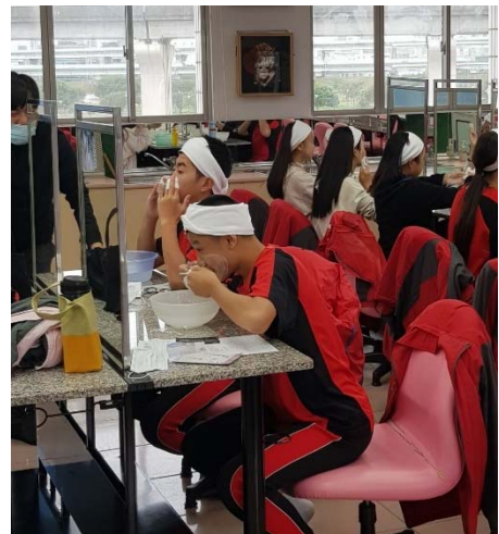
說明：家政群-時尚造型科實作體驗