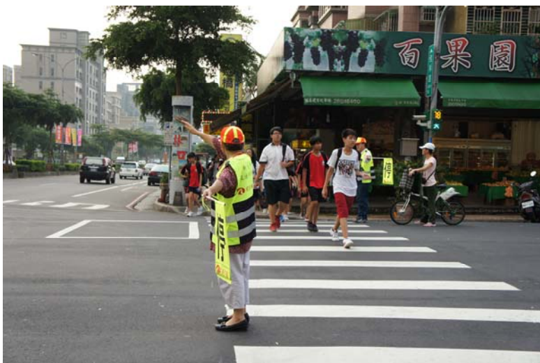
新北市佳林國民中學 108 學年度 第一學期導護志工輪值表